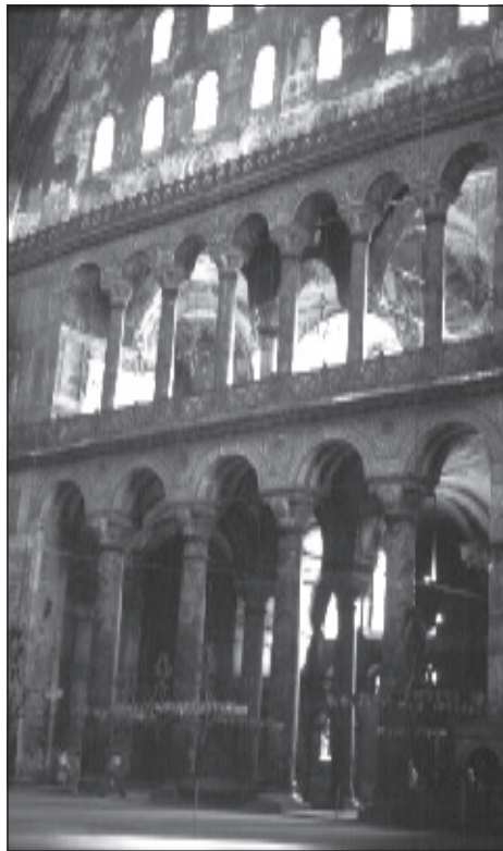
Храм Св. Софии. Внутренний вид. Боковые галереи.

Видимо, Феофил как-то почувствовал, что Кассия не хочет быть избранной, и поэтому решил косвенным образом узнать это точно у нее самой — и сказал свою фразу про зло, происшедшее от женщины, как бы вопрошая: «Ты согласна стать моей женой?» Ответ Кассии — возражение — означал: «Нет». Именно потому Феофил и отошел от нее, «уязвленный в самое сердце». 22 Интересно и самое содержание фраз, которыми они обменялись. Феофил сказал: «Через женщину излилось зло». Здесь имеется в виду Ева, первая вкушившая запретный плод и ставшая виновницей изгнания из рая и всех дальнейших людских бедствий, трудов и скорбей — в том числе и супружества в том виде, в котором мы его знаем. 23 Кассия же, продолжив цитату, процитировала: «Через женщину простирается лучшее», — имея в виду Божию Матерь, покровительницу девства; «лучшее», простирающееся от нее, было — спасение и нетление, Христос-Спаситель, Который всех призвал к совершеннейшему — девственному — житию, Сам являясь «славой девства», как говорит св. Иоанн Дамаскин: «Он превыше нас воплотился от Девы без [супружеского] соединения и Сам в Себе самом показывал истинное и совершенное девство. Посему, хотя он и не предписал нам этого [девства] законом, ибо не все вмещаются словесе сего, как Он Сам сказал; но делом наставил нас и дал нам силу для него. Ибо