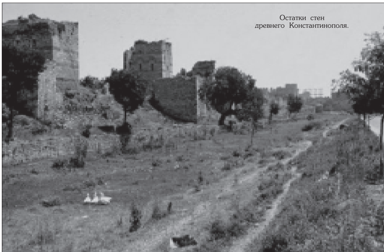
Остатки стен древнего Константинополя.

ла 17 решила устроить для сына выбор невест, для чего со всей Византийской империи были собраны отличавшиеся красотой девицы. Императрица отобрала среди них 12 самых красивых. Феофил должен был протянуть золотое яблоко той, которую захочет взять себе в жены. 18