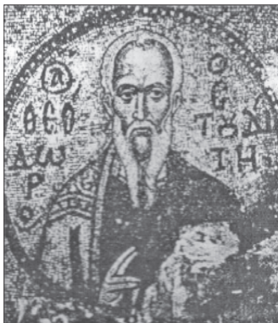
Св. Феодор Студит

Мнения ученых относительно того, когда именно происходит этот выбор невест, расходятся. Одни счи-