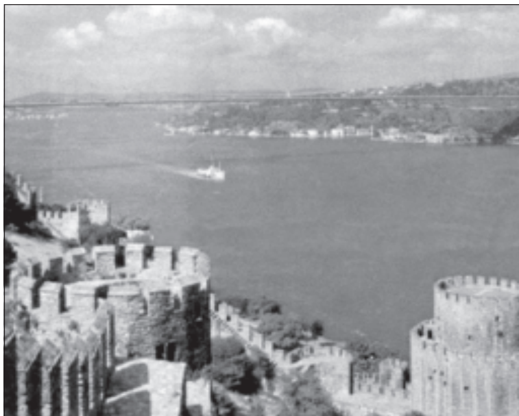
Вид на пролив Босфор и стены Константинополя

Некоторые исследователи просто отказывали Кассии в авторстве этой стихирю на том основании, что «холодная гордая девица» не могла с такой силой и чувством передать переживания падшей женщины, 30 — но конечно, подобные рассуждения выглядят смешно для того, кто хоть немного знаком, по собственному опыту или хотя бы по святоотеческим описаниям, с тем, как проходит у подвижников борьба со страстями 31 — как самые постыдные страсти могут нападать на тех людей, которые до того никогда не испытывали наслаждения ими на деле. Например, св. Иоанн Лествичник говорит: «Змий сладострастия многообразен; не вкусившим сласти греха он внушает, чтобы только однажды вкусили ее и перестали, а вкусивших коварный побуждает воспоминанием опять к совершению греха. Многие из первых, поелику не знают зла сего, бывают свободны и от борьбы; а из последних многие, как познавшие опытом сию мерзость, терпят стужение и брани. Впрочем, часто случается и совсем противное этому». 32