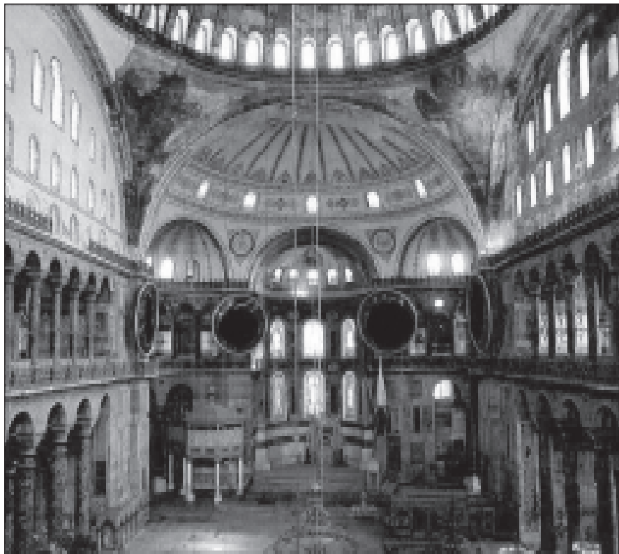
Храм Св. Софии. Внутренний вид.

чил ее имя в свой рифмованный перечень знаменитых поэтов-гимнографов, наряду с именами прп. Феодора Студита, свв. Косьмы Маиумского, Андрея Критского, Феофана и других. Св. Кассия — прак-