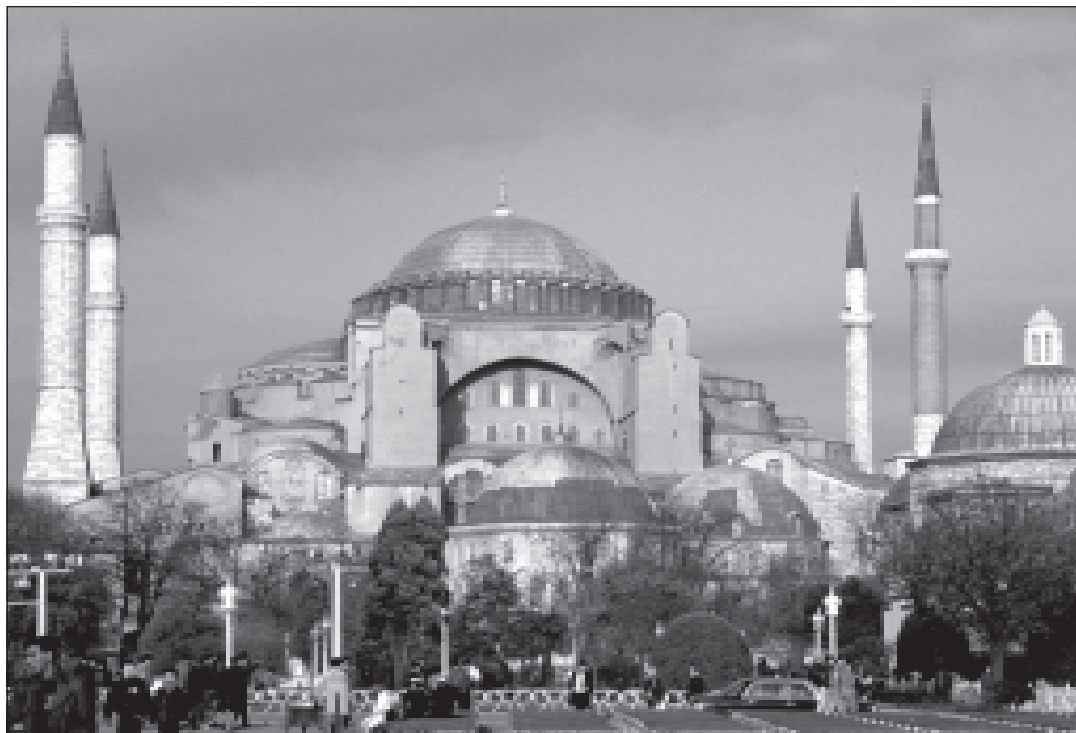
Константинополь. Храм Святой Софии (VI в.); современный вид, с минаретами, пристроенными турками.

писем св. Феодор передает поклон матери Кассии и благодарит за то, что Кассия с матерью прислали ему в ссылку; в другом письме он благодарит св. Кассию за благодеяния, оказываемые ею монаху Студийского монастыря Дорофею, который был заключен в темницу за иконопочитание. Св. Кассия и сама, как видно из письма св. Феодора, претерпела бичевание за иконопочитание, т.е. активно участвовала в православном сопротивлении ереси.