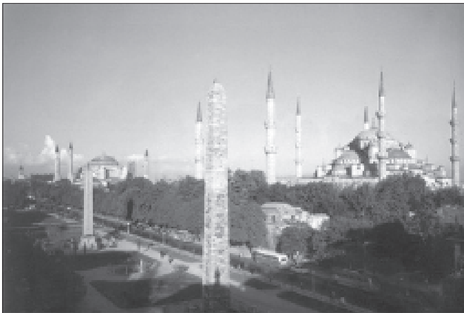
Константинополь. Вид на ипподром и храм Св. Софии