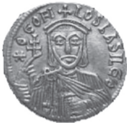
Император Феофил. Изображение на монете (830-е гг.)

ситуация возникла очень похожая, дописал: «страхом скрыся», — как Ева тогда в страхе скрылась от Бога, так и Кассия, услышав шаги Феофила за дверью кельи, от страха скрылась... Кассия, найдя свою стихирю дописанной, согласилась с таким продолжением и дописала конец. Таким образом, согласно легенде, знаменитая стихира была плодом совместного творчества игуменьи и императора. 35